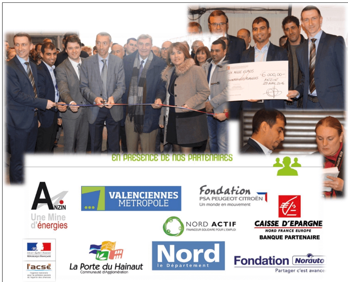
Inauguration d'un nouveau "garage solidaire" à Anzin, le 29 avril 2016 avec la réception d'un chèque de 6 000 €

enquête pour y intégrer d'autres données troublantes. Des « adeptes » d'Hassan Iquioussen se trouvent disséminés partout, faisant la courte échelle à d'autres « adeptes ». A l'image d'un converti très actif, « le bras droit d'Hassan Iquioussen » à la mosquée frériste de Raismes, membre de Convergences Plurielles, occupant un post clé au sein du syndicat « Sud Transports Nord-Pas-de-Calais », salarié de Transvilles (ex SEMURVAL) et proche de la députée-maire Anne-Lise Dufour-Tonini qui occupe, elle, le poste de présidente élue du SITURV (Syndicats des Transports Urbains de la Région de Valenciennes)[108].